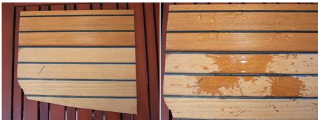
Tikovina sa 2 ruke